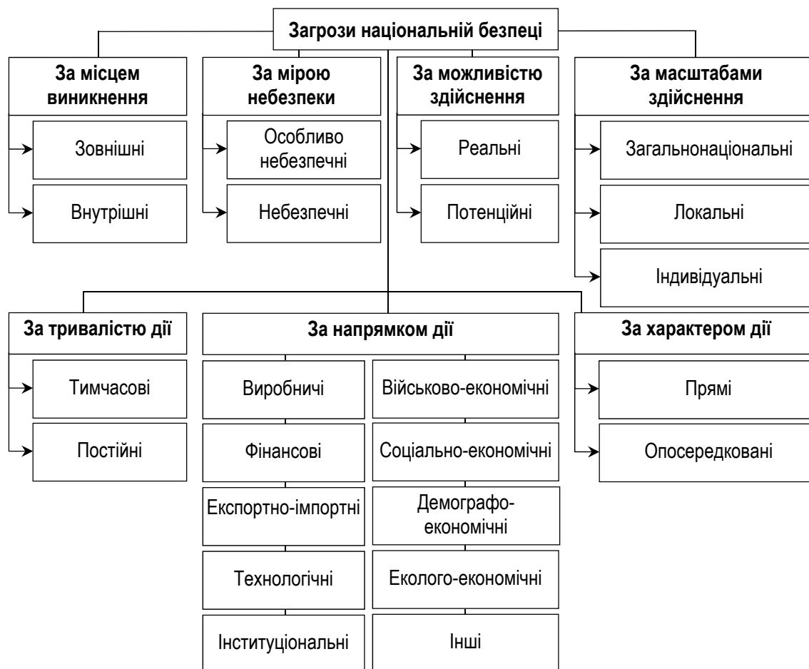
Рисунок 1 – Класифікація загроз національній економічній безпеці [10]

На сьогодні основними загрозами національній безпеці в економічній сфері є: