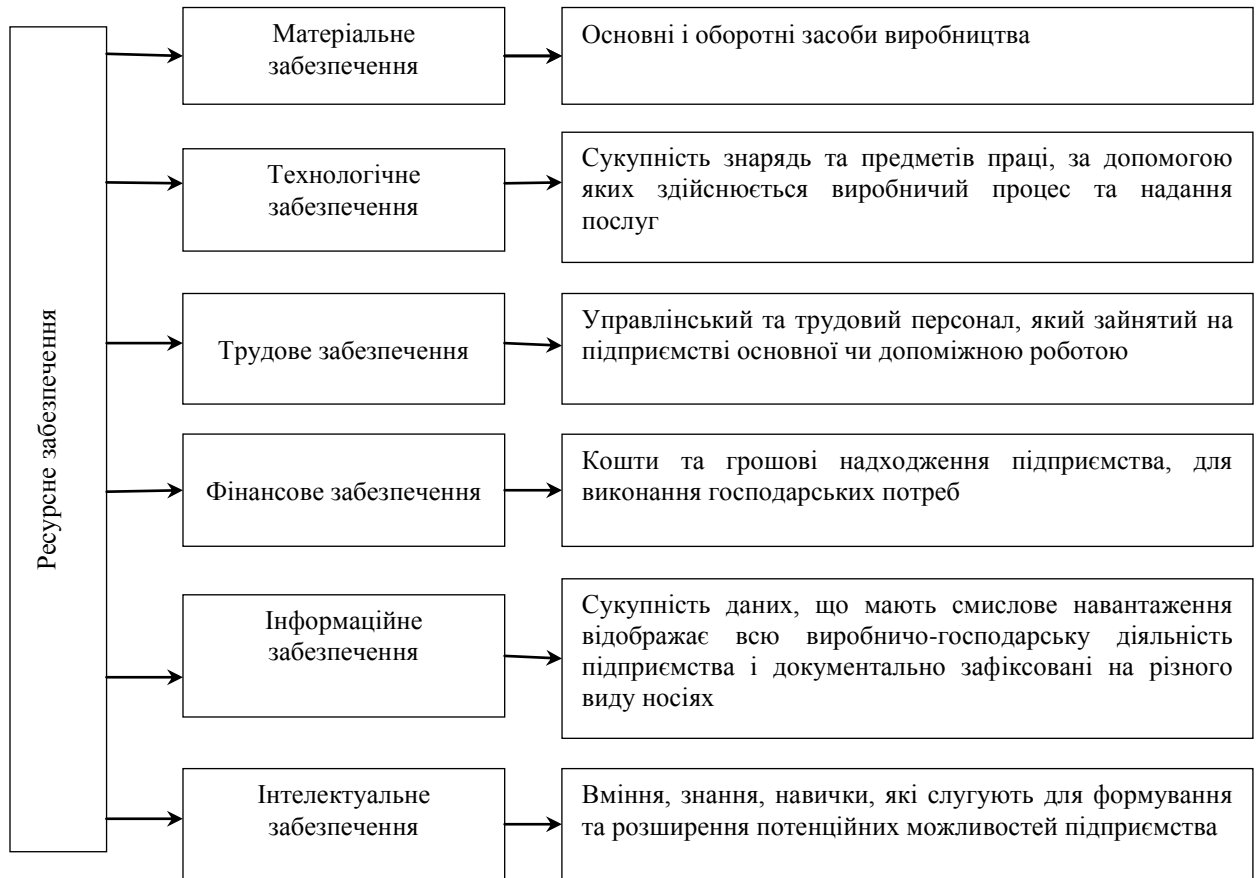
Рис. 1. Групи ресурсного забезпечення підприємства

галузі виробництва. Але ми обираємо стандартній набір ресурсного забезпечення, адже досліджуємо не конкретну галузь виробництва, а загальне бачення проблеми забезпечення.