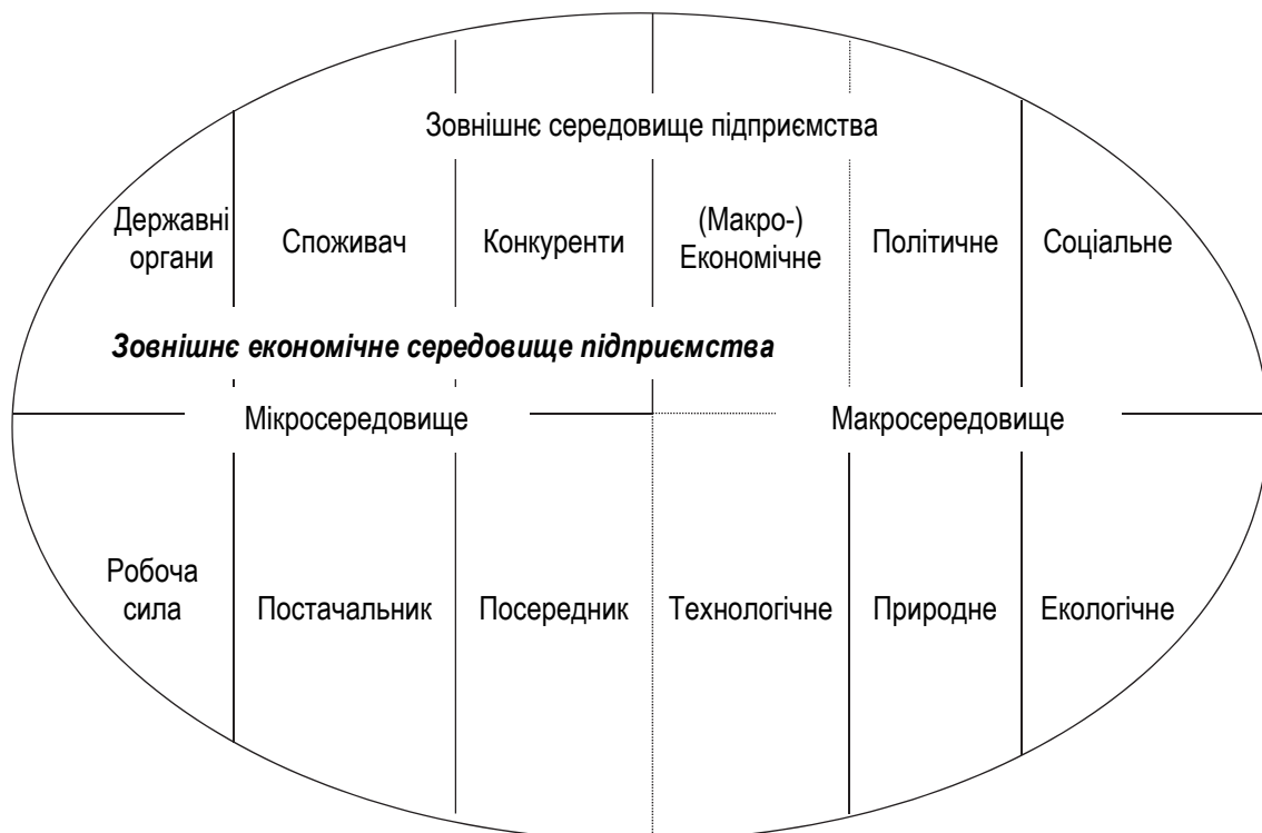
Рисунок 1 – Місце економічного та макроекономічного середовищ у зовнішньому середовищі підприємства

Отже, співвідношення зовнішнього економічного середовища підприємства та його макроекономічного середовища можна зобразити (рис. 1):