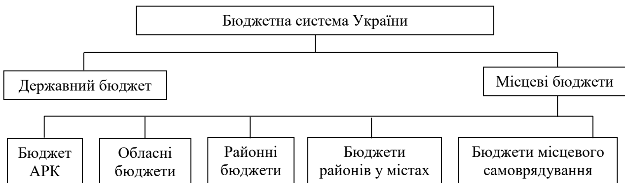
Рисунок 1 – Структура рівнів бюджетної системи України

На рисунку 1 наведена схема рівнів бюджетної системи, що складена відповідно до норм Бюджетного кодексу України.