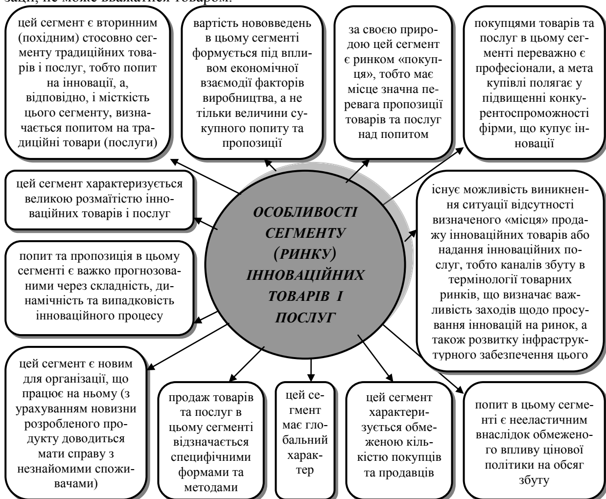
Рис. 4. Специфічні особливості сегменту (ринку) інноваційних товарів і послуг

Висновки. Підводячи підсумок, зазначимо, що формування ринку інноваційного інвестування сьогодні слід вважати ключовою й узагальнюючою вимогою до інвестиційних пріоритетів економічної системи, що обумовлено змістом сучасного процесу економічного розвитку, оскільки інновації стали явищем, що постійно його супроводжує, з фактора зовнішнього (екзогенного) перетворилися у фактор ендогенний. У цих умовах принципового