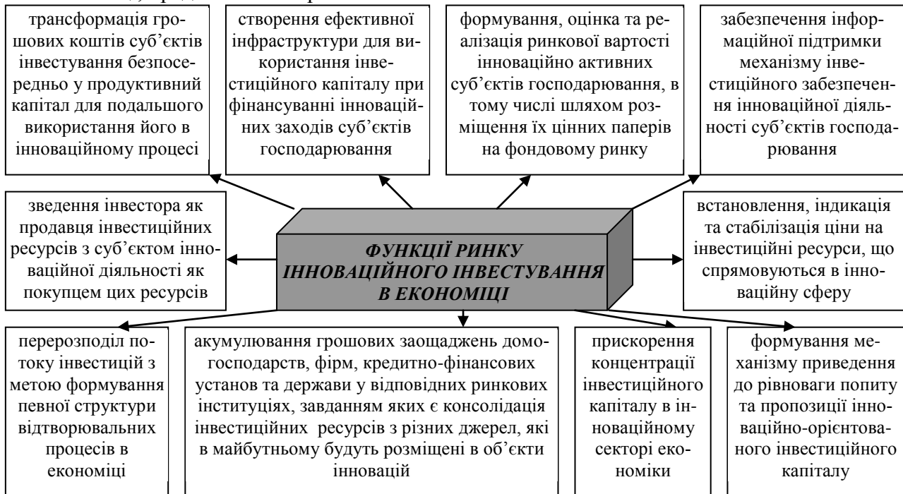
Рис. 1. Функції ринку інноваційного інвестування в економіці

Ринку інноваційного інвестування належить виключно важлива роль у формуванні, мобілізації, використанні та відтворенні інвестиційного потенціалу як сукупності наявних коштів та можливостей їх використання в інноваційній сфері. Функції, які він має виконувати в економіці, представлені на рис. 1.