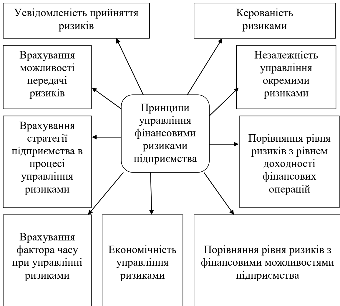
Рис. 2. Принципи управління фінансовими ризиками

Висновки. Таким чином, дослідивши основні методологічні та методичні підходи щодо управління фінансовими ризиками підприємства можна зробити узагальнені висновки: