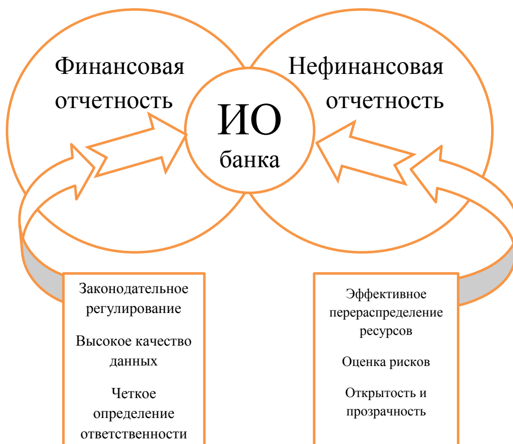
Рис.1. Модель системы интегрированной отчетности банка.

(разработано автором по данным проведенного исследования)