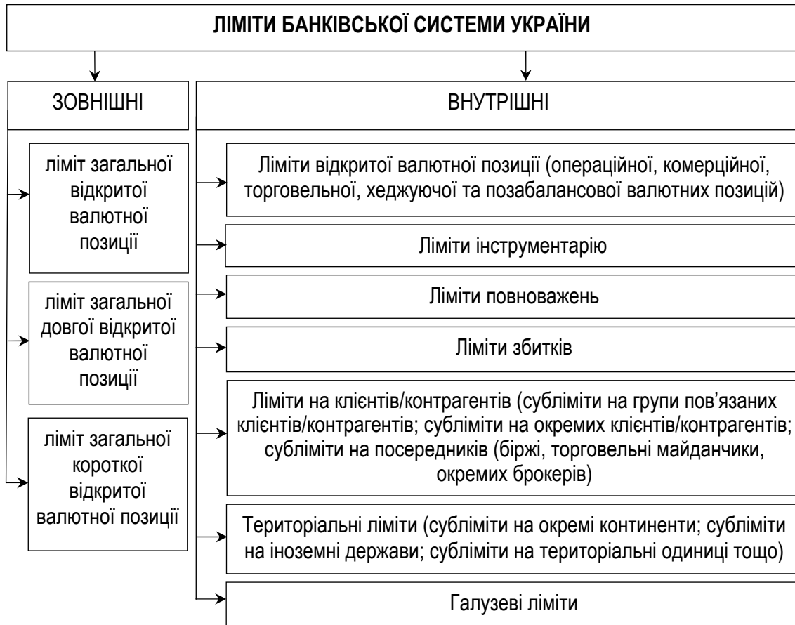
Рисунок 2 – Різновиди лімітів у банках України за операціями з валютою та банківськими металами