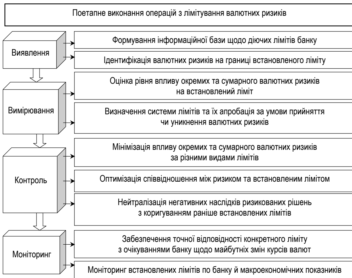
Рисунок 1 – Основні елементи та етапи процесу лімітування валютних ризиків у банку

Зовнішні ліміти встановлюються НБУ й розподіляються на: