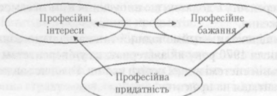
Рис. 2. Вирішальні критерії при виборі фаху.

Як пов'язані ці три критерії між собою? На рис. 2 відображене співвідношення цих критеріїв.