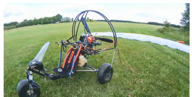
Літальний засіб Е. Келлера