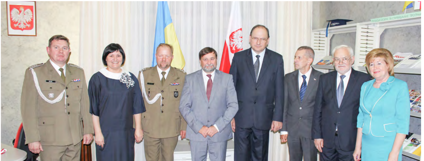
У Польсько-українському центрі

А організатори виставки вже виношують плани щодо нових проєктів, які не лише розширять наш світогляд, а й сприятимуть розвитку польсько-української дружби.