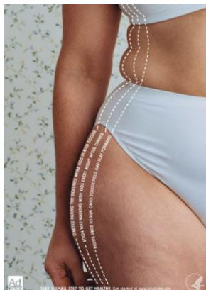
Rys. 1 Kampania społeczna Small Step - Amerykańska kampania jest odpowiedzią na otyłość amerykańskiego społeczeństwa