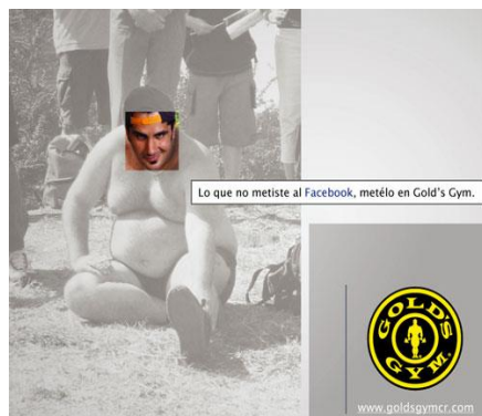
Rys. 2 - Kampania sieci fitness klubów Gold's Gym

Z rezultatów badań wynika, że zaprezentowane kampanie społeczne shockvertisingowe wzbudzają jedynie zainteresowanie ankietowanych. Według badanych, reklamy są męczące a wykorzystanie elementów szoku nie jest czynnikiem decydującym o chęci podjęcia aktywności fizycznej. Częściej motywatorami podjęcia aktywności byli członkowie rodziny i rówieśnicy. Ankietowani deklarowali, że shockvertising wywołuje w nich raczej takiej emocje jak niesmak, oburzenie, smutek oraz obojętność.