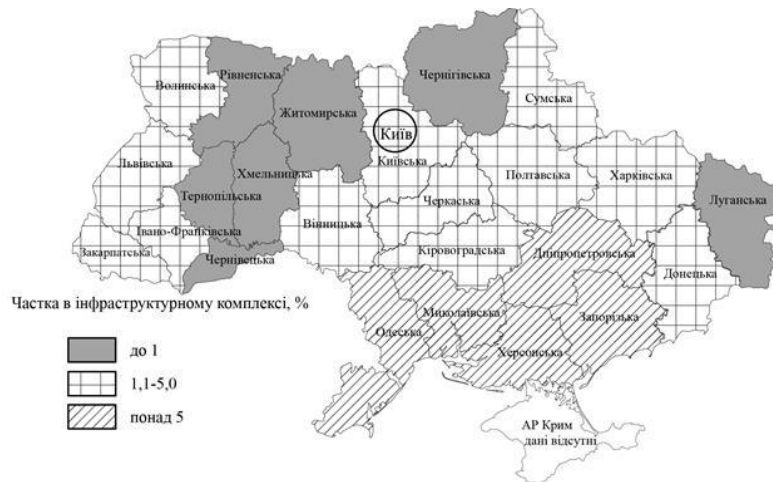
Рисунок 2 – Частка інфраструктурного комплексу курортно-рекреаційної сфери за регіонами України (2016), % (сформовано автором за даними [10])

Частка в інфраструктурному комплексі курортно-рекреаційної сфери розраховувалась за показником кількості спеціалізованих засобів розміщування конкретного регіону в загальній сукупності таких засобів в Україні за 2016 рік, як головного компоненту інфраструктурного забезпечення курортно-рекреаційної галузі (рис. 2).