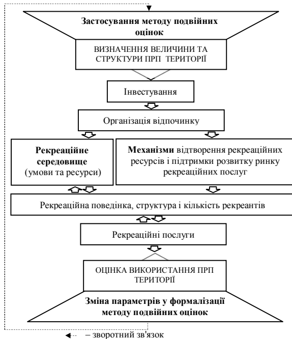
Рис. 2. Схема застосування оптимізаційного методу подвійних оцінок при використанні природно-рекреаційного потенціалу території

Доведена доцільність використання запропонованого оптимізаційного методу подвійних оцінок як аналітичного інструменту механізму використання та розвитку природно-рекреаційного потенціалу території на всіх етапах даного механізму (рис. 2). На основі результатів економіко-математичного обчислення величини та структури природно-рекреаційного потенціалу і комплексного аналізу можливостей розвитку рекреаційної діяльності в регіоні здійснюються планування та реалізація відповідних інвестиційних, організаційних, виробничих і регулятивних заходів.