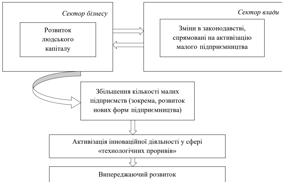
Рисунок 2– Спрощений механізм переходу на шлях випереджаючого розвитку [10]

В сучасній новітній економіці за основу діяльності приймають інтелектуальний капітал та інновації, а стратегічне планування базується на розвитку інформаційної інфраструктури, ускладненні виробничих процесів, створенні і дотриманні високого рівня наукоємності продукції промислових підприємств, скороченні тривалості життєвого циклу нових товарів разом з дотриманням виробничих вимог відповідно до нових технологічно-конструктивних принципів.