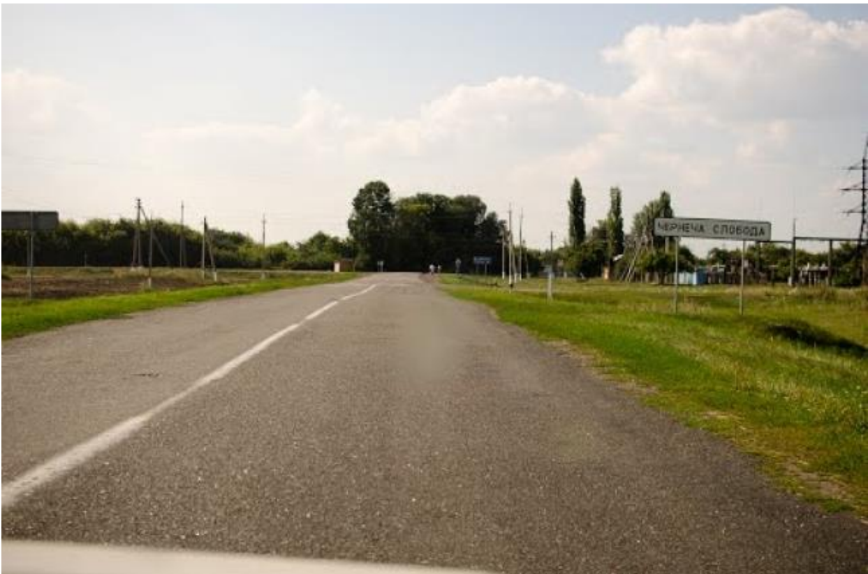
На під'їзді до села Чернеча Слобода з боку Сум