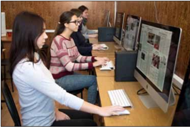
Рис. 1. Студентська газета готується на сучасному комп'ютерному обладнанні

Друкована версія кожного номера розміщується в холі факультету, де з нею може ознайомитися кожен охочий. Періодичність виходу газети – два рази на місяць.