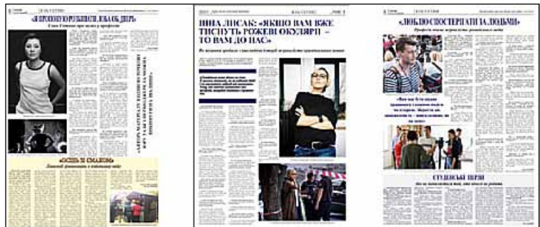
Рис. 4. На останній шпальті кожного випуску вміщується інтерв'ю з відомим журналістом про секрети професійної майстерності