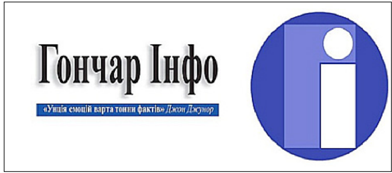
Рис. 3. Логотип газети розроблено студентами за матеріалами відеолекцій та статей про графічний дизайн в мережі Інтернет

На шпальтах газети представлені основні жанри журналістики: стаття, репортаж, інтерв'ю. Отже, робота над її випуском дозволяє сформувати навички роботи у цих жанрах.