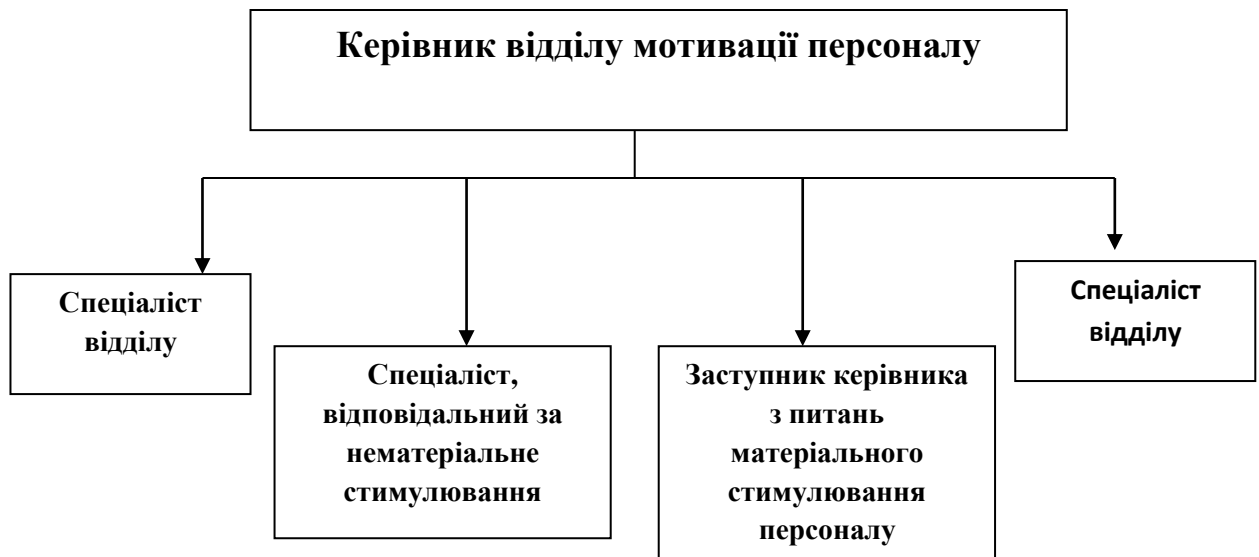
Рисунок 3.1 - Організаційна структура відділу мотивації персоналу

Як видно з рисунку 3.1. відділ складається з п'яти працівників: керівника та чотирьох спеціалістів. Розглянемо посадові обов'язки керівника та спеціалістів даного відділу: