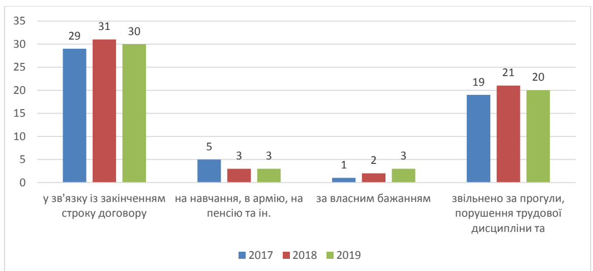
Рисунок 2.2 Рух робочих кадрів, осіб