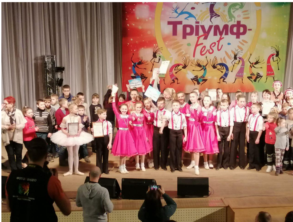
Рис.6 Ансамбль «Смайл» - переможець Міжнародного конкурсу «Тріумф – FEST»