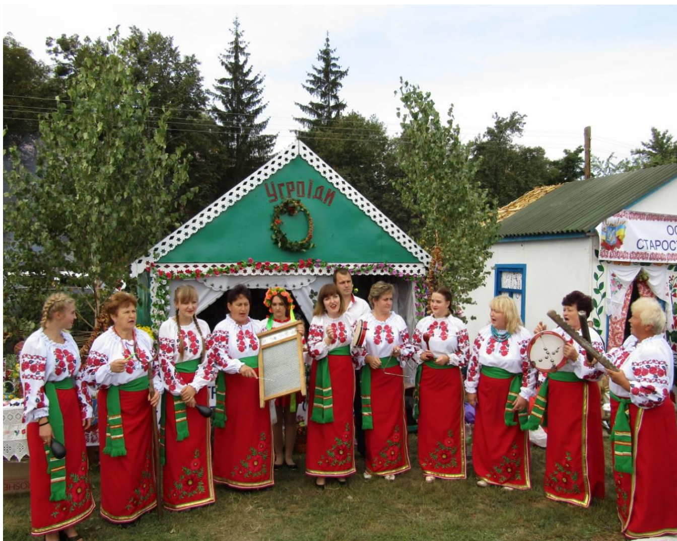
Рис.4 Учасниці жіночого вокального ансамблю «Веселинка»