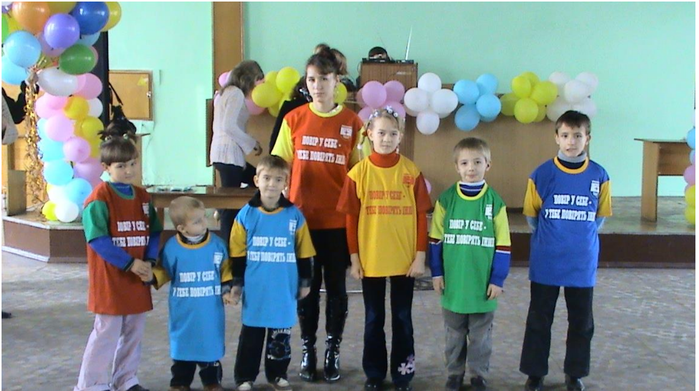
Рис.2 Участь вихованців ДБСТ у районному творчому конкурсі «Повір у себе»