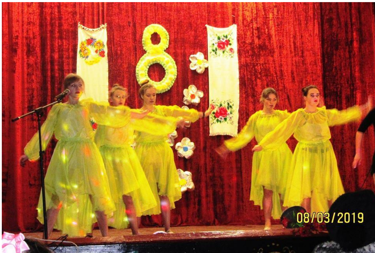
Рис.5 Хореографічний колектив «Експресія»