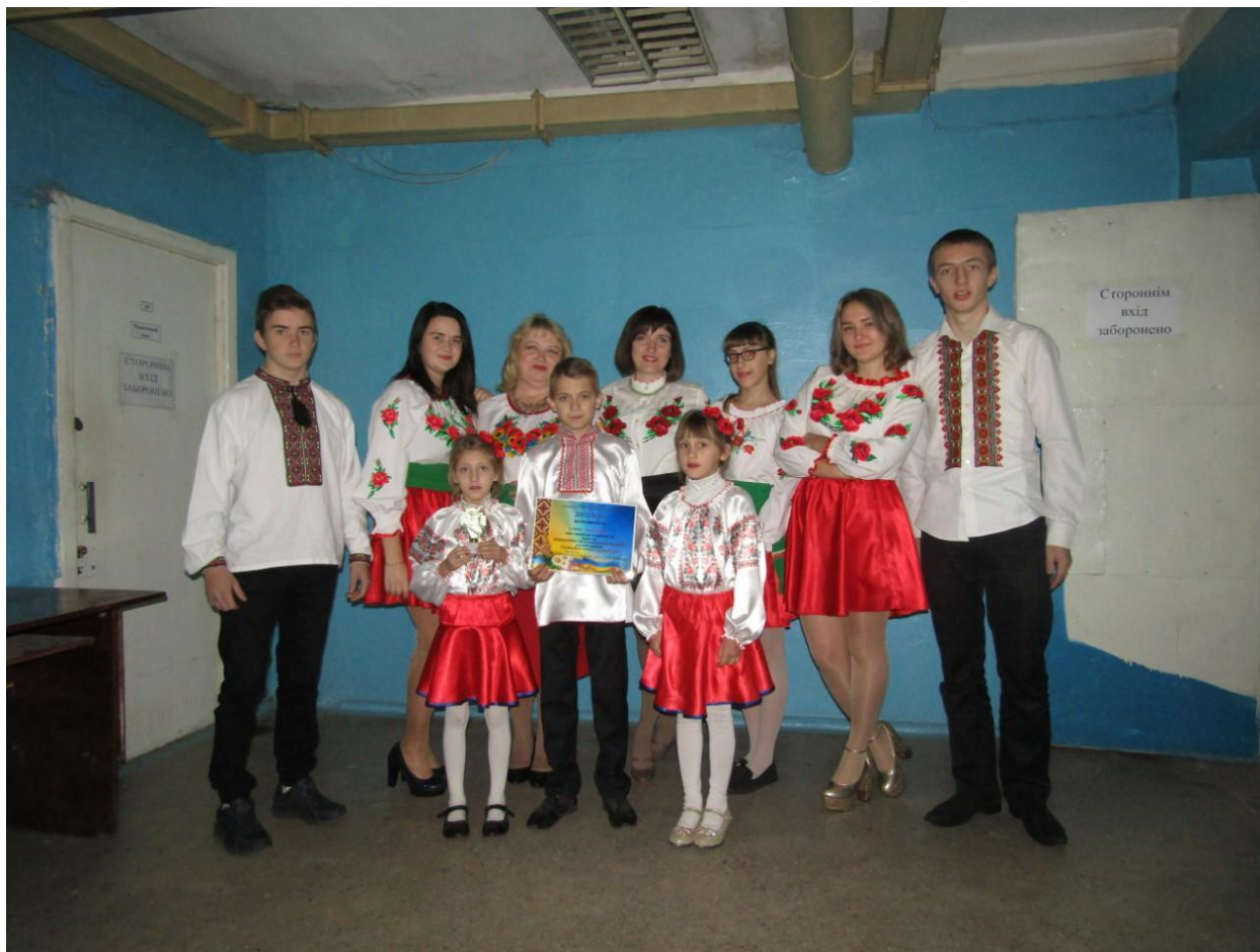
Рис.1 Родинний вокальний ансамбль «Весела сімейка»