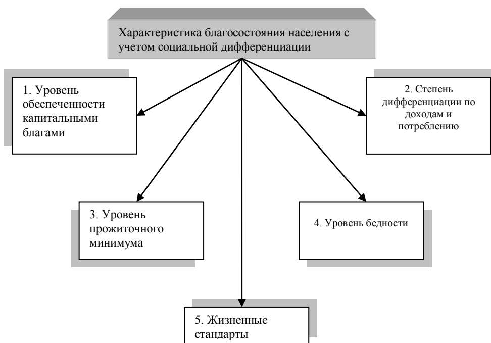
Рисунок 2 – Базовые понятия благосостояния населения

Как известно, на здоровье населения оказывают воздействие различные факторы. По нашему мнению, наиболее весомым фактором воздействия является состояние