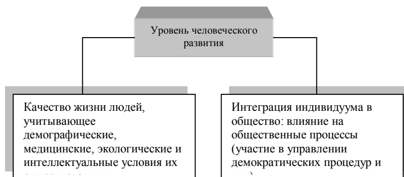
Рисунок 3 – Основные элементы уровня человеческого развития

В настоящее время нет определенности относительно того, что следует понимать под качеством жизни населения. Чаще всего качество жизни оценивается на основе определения уровня (индекса) развития человеческого фактора (потенциала).