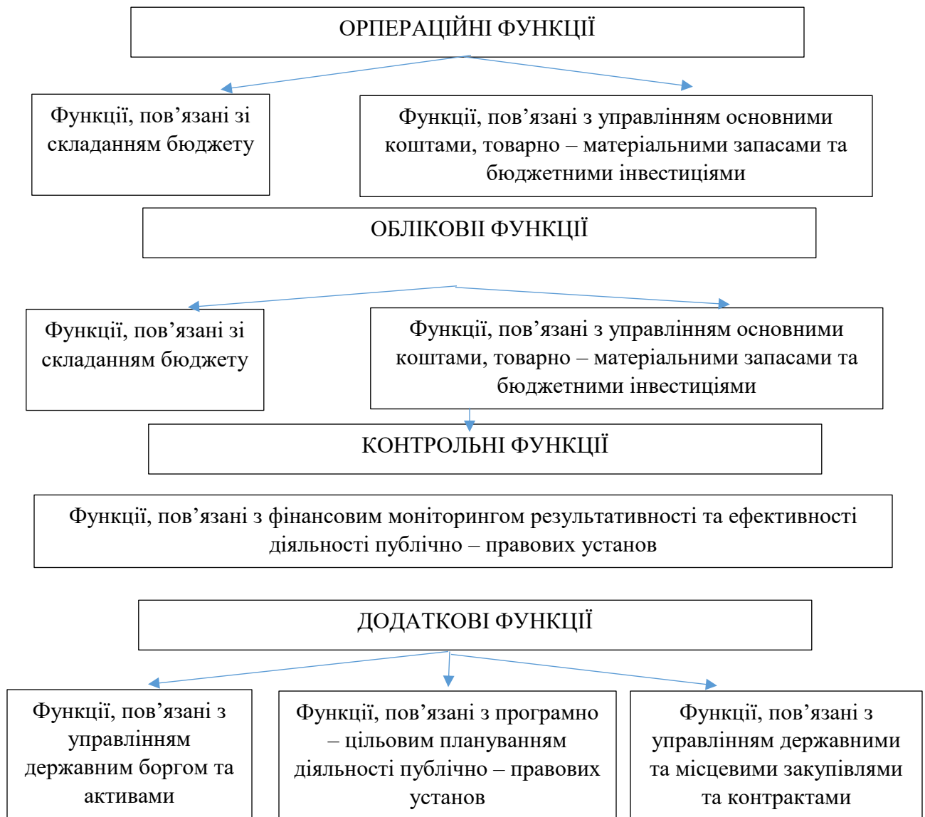
Рисунок 1.2 – Спроектоване групування функцій Державна казначейська служба України