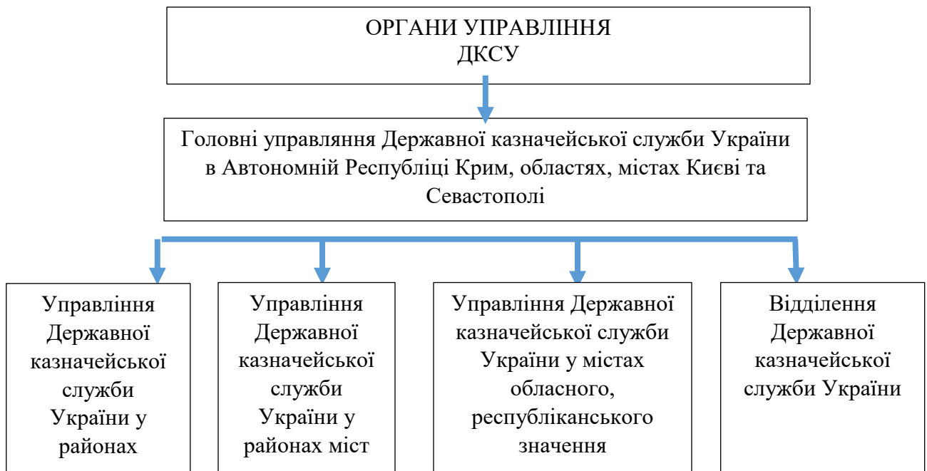
Рисунок 2.1 – Організаційна структура ДКСУ

Кожна правова держава в процесі свого функціонування повинна забезпечувати організацію та здійснення фінансового контролю який полягає в дотриманні органами державної влади та місцевого самоврядування, юридичними та фізичними особами фінансового законодавства України, а також ефективного використання державних фінансових та матеріальних ресурсів.