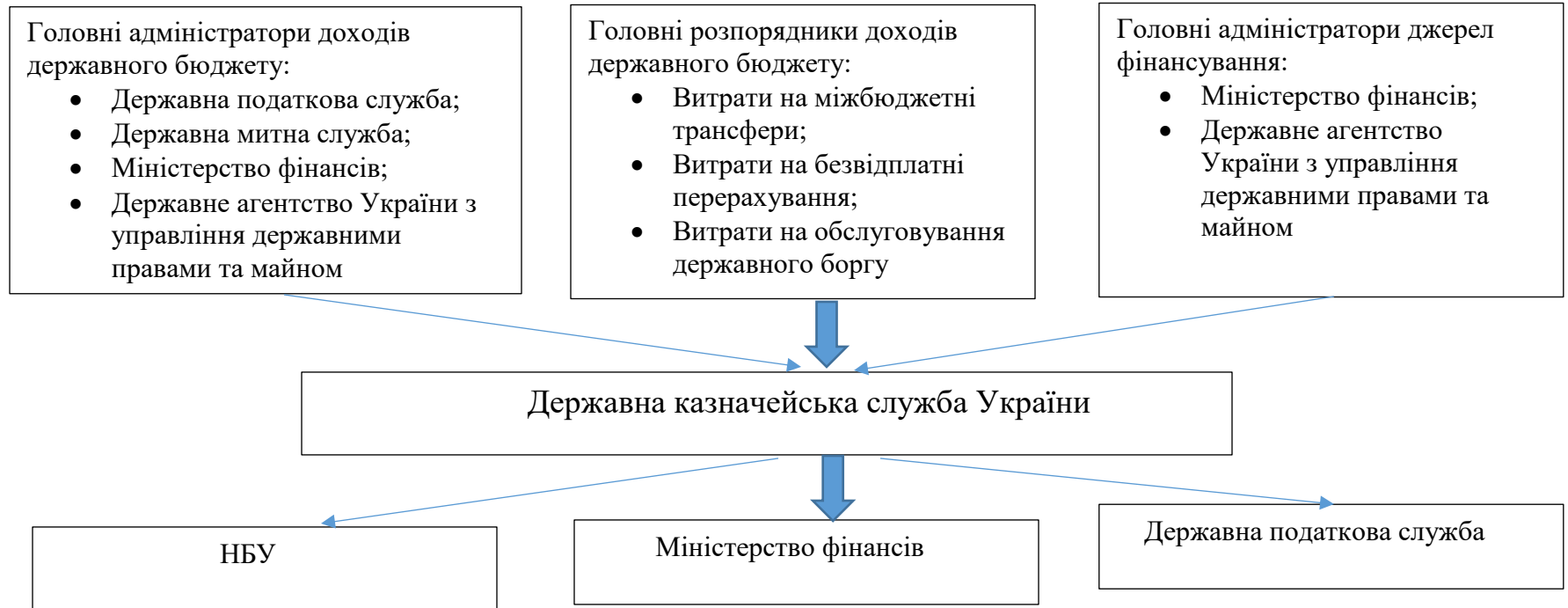
Рисунок 1.1 – Взаємодія учасників процесу складання касового плану виконання державного бюджету