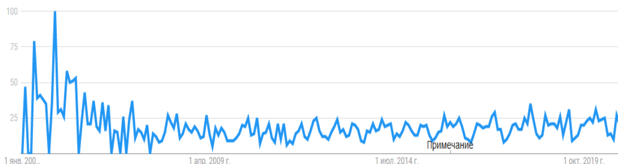
Рисунок 2 – Результати запитів користувачів Google Trends щодо економічної нестабільності у світі за період 2004-2020 рр. [2]

На сучасному етапі розвитку науки дані проблеми набувають дедалі більшої актуальності і досліджуваності. Аналогічні тенденції були встановлені і для решти аналізованих дефініцій.