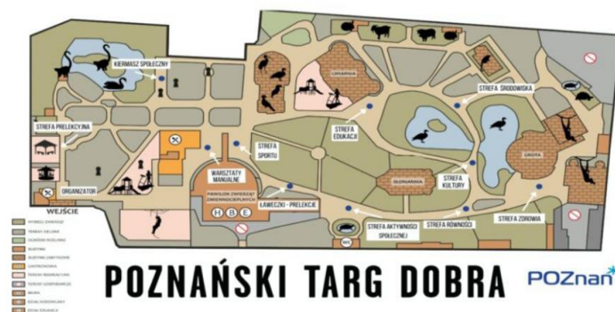
Рисунок 1.1 – Мапа "Познанського ярмарку добра"

Місто Познань підтримує ініціативи, спрямовані на повну інтеграцію іноземців та забезпечує їх допомогою, зокрема, через такі заходи, як: виплата грошової допомоги власникам Карти поляка, репатріантам та членам їхніх сімей та іноземцям, які отримали дозвіл на проживання з гуманітарних причин або за толерантне перебування на території Республіки Польща, а також через діяльність Центру міграційних досліджень [80] та реалізацію наступних проектів Migrant Info Point та #AKTYWATOR WLKP, в рамках яких діють, зокрема, гаряча лінія Migrant.info та Познанський інтеграційний центр – POINT [40], який є підрозділом Міграційного інформаційного пункту – місця надання комплексних послуг для іноземців [26, 38]. [40], який є підрозділом Міграційного інформаційного пункту – місця надання комплексних послуг для іноземців [26, 38].