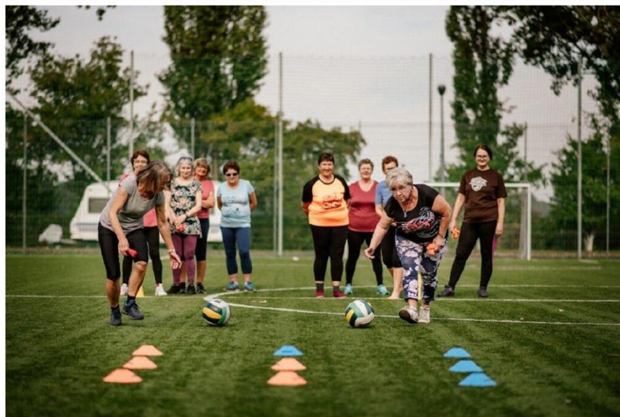
Рисунок 3.3 – Заняття в рамках проекту "Старший тренер"

- проект "Сеньйоральний тренер" – передбачає безкоштовні спортивно-рекреаційні заняття спортом, програма яких, серед іншого, включає в себе танцювальні та гімнастичні заняття, які проводять студенти та випускники Академії фізичного виховання або споріднених університетів; у 2021 році у заняттях взяли участь близько 4 500 осіб [54];