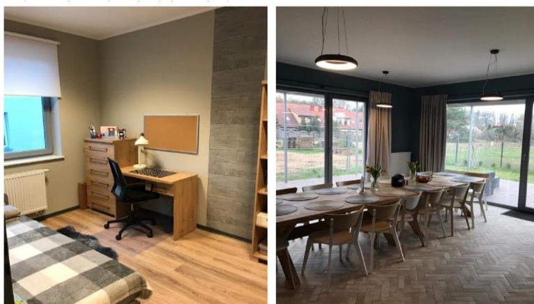
Рисунок 2.2 – Кімната та їдальня закладу опіки «Марцелін»

Станом на 1 січня 2022 року всі заклади опіки та виховання в Познані відповідають стандартам, передбаченим Законом від 9 червня 2011 року “Про підтримку сім'ї та систему патронату над дитиною”, згідно з яким кількість дітей, які перебувають під опікою або піклуванням у навчально-виховному закладі не може перевищувати 14 осіб. В рамках поетапного досягнення стандарту догляду та виховання з 1 січня 2022 року розпочали роботу 6 нових закладів цілодобового догляду та виховання [82].