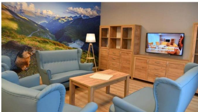
Рисунок 3.1 – Новозбудований корпус будинку

Загалом в наявності є 656 постійних місць, якими на кінець 2021 року скористалися 575 осіб похилого віку або хронічно соматично хворих. Понад три чверті осіб, які перебували в установах, потребували постійного догляду [36].