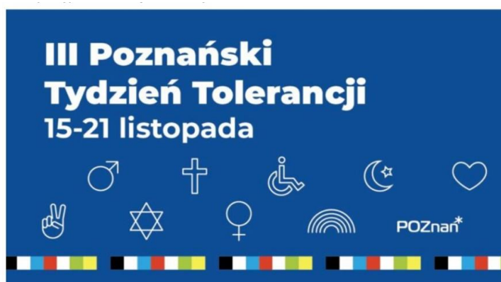
Рисунок 1.2 – Третій Познанський тиждень толерантності

центр медіації, який включає організацію медіації за принципом "рівний-рівному" у школах. Сума виділених коштів на виконання цієї програми у 2021 році становила 100 000 злотих.