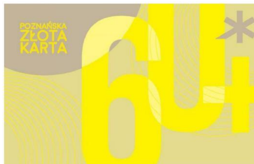
Рисунок 3.2 – Познанська Золота Карта

- Карта Сеньйора – Золота карта Познаня – полегшує доступ літніх людей до широкого спектру послуг закладів культури, дозвілля, спорту, відпочинку, туризму, освіти, а також товарів, що пропонуються органами та установами місцевого самоврядування і приватних компаній (всього 158 партнерів); проект адресований людям, яким виповнилося 60 років; у 2021 році було видано 1500 карток, з моменту створення програми загалом було випущено 32400 карток;