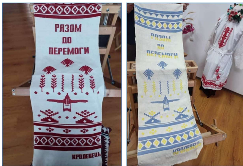
Фото 2. Панно із фондів музею Кролевецького ткацтва

патріотичному жовто-блакитному кольорах. Краї панно оздоблено смужками, ромбами, написом «Кролевець». У центральній частині зображено традиційний кролевецький символ – «Берегиня» з піднятими руками, вона ніби допомагає злетіти байрактару, який має захистити нашу землю та знищити всіх ворогів. Над байрактаром зображено зерна на колоски, що символізують початок нового життя, відродження України, далі пташки – символи свободи та волі. Завершується панно написом «Разом до перемоги».