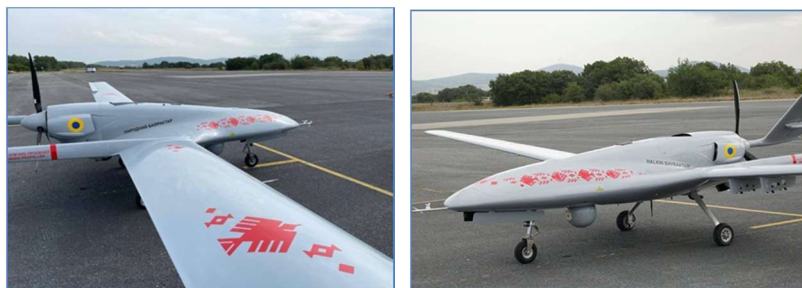
Фото 4. Візерунки на безпілотниках «Bayraktar» зроблено на основі крелевецьких орнаментів

Крім того, крелевецькі орнаменти зображені й на безпілотних літальних апаратах «Bayraktar», або як їх називають «Народні байрактари», адже на них збирали гроші мільйони громадян нашої держави. Центральним елементом орнаменту є птахи, зокрема ластівка, як передвісниця відродження і добра. Компанія «Bayraktar», зробила такий подарунок українцям до Дня Незалежності України в 2022 року [2].