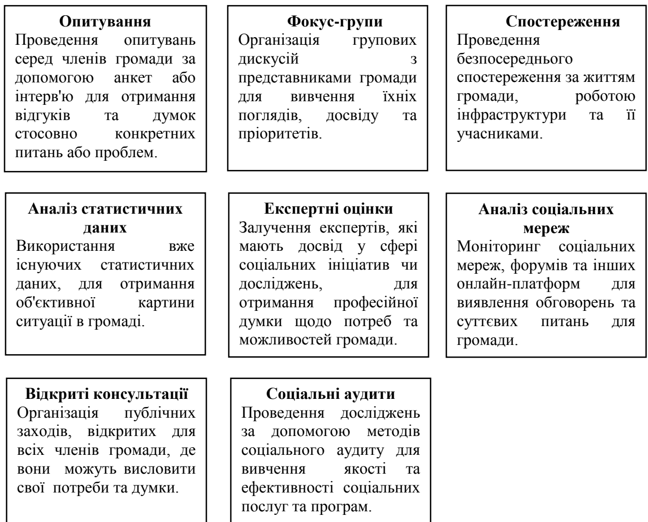
Рисунок 2.1 – Методи для збору та аналізу інформації про потреби громади

Методи збору та аналізу інформації про потреби громади визначаються з урахуванням специфіки конкретного проєкту та особливостей громади. Важливо використовувати різноманітні підходи для отримання повного та об'єктивного зображення потреб та проблем. (Лях та ін., 2022) На рис. 2.1 візуалізовано методи, які можна використовувати для збору та аналізу інформації про потреби громади.