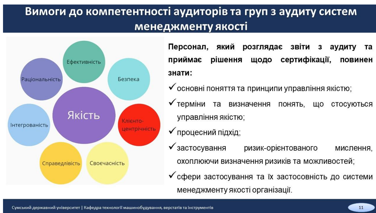
Рисунок 2.5 – Вимоги до знань персоналу, який розглядає звіти з аудиту та приймає рішення щодо сертифікації

Персонал, який розглядає звіти з аудиту та приймає рішення щодо сертифікації, повинен знати інформацію що представлена на рис. 2.5.