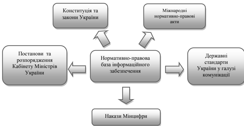
Рисунок 1 – Нормативно-правова база інформаційного забезпечення

Інформаційне забезпечення процесів управління є важливим компонентом у системі взаємодії органів публічної влади з бізнесом, громадянами та між собою, як між суб'єктами адміністративного права. Відповідно до цього загальні принципи та засади інформаційного забезпечення ґрунтуються на численних нормативно-правових актах, що формують собою цілу систему законодавчого регулювання інформаційних відносин в Україні (рис. 1).