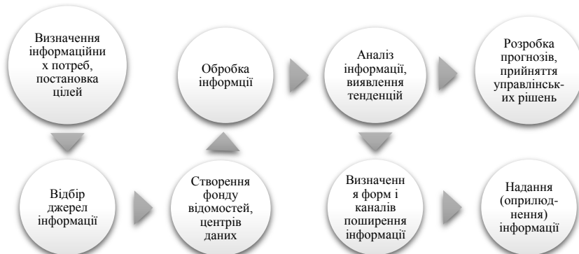
Рисунок 2 – Основні етапи інформаційного забезпечення державних установ.