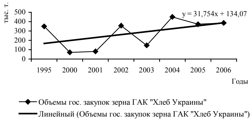
Рисунок 2 – Объемы государственных закупок зерна ГЭК «Хлеб Украины» в АПК за 1995-2006 гг.

С целью стабилизации рынка зерна создан Государственный интервенционный фонд стабилизации зернового рынка в Украине. Выделяют следующие основные функции фонда: