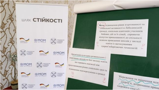
Фото із першої фасилітаційної зустрічі: