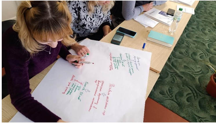
Фото із другої фасилітаційної зустрічі: