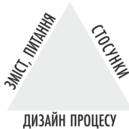
Рисунок 1.2 – «Трикутник успіху фасилітатора»

Для успішного проведення фасилітаційних зустрічей у своїй роботі фасилітатори керуються «трикутником успіху» (рис 1.2), в якому всі елементи взаємопов'язані та в комплексі сприятимуть досягненню поставлених цілей: