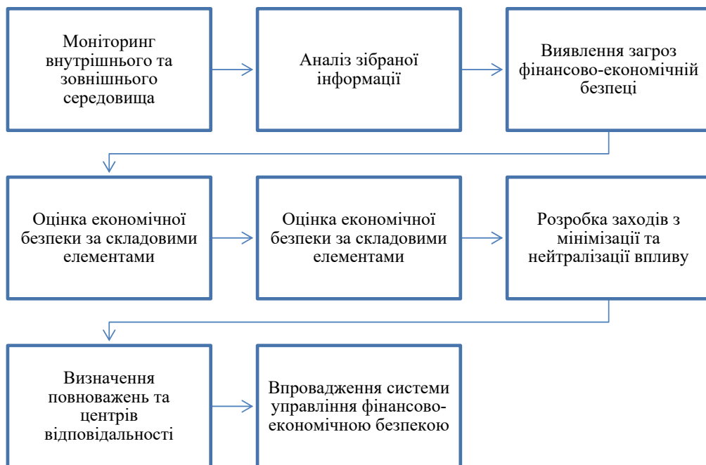
Рисунок 3 – Система управління фінансово-економічною безпекою підприємства