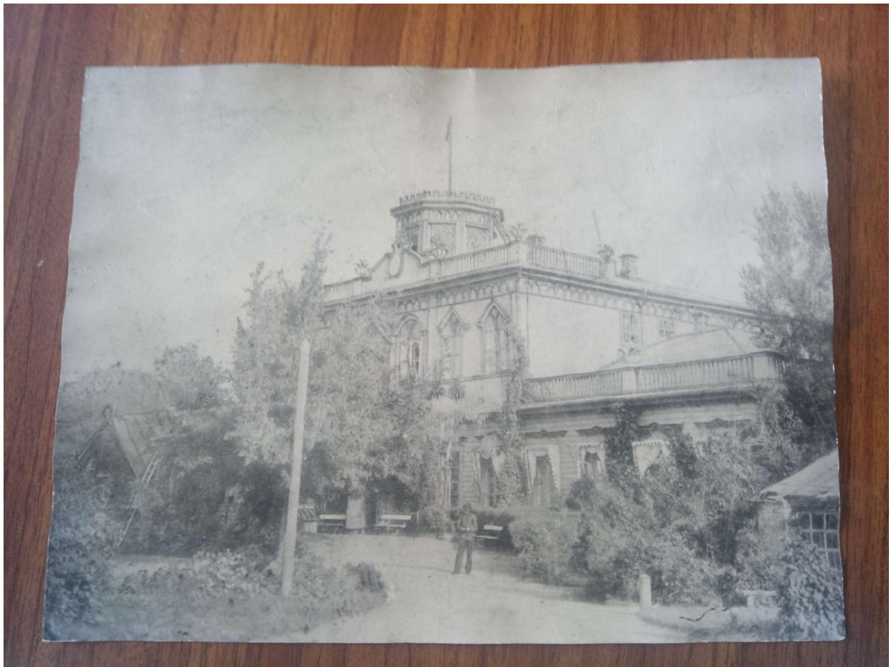
Лубенський міський державний архів. Ф. 62. Спр. № 524. Арк. 7.