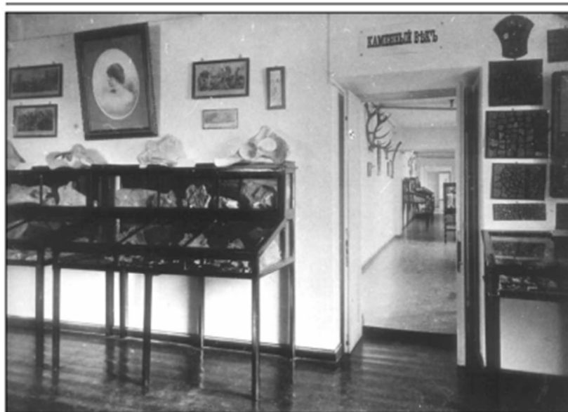
Розділ IV. Археологічне зібрання музею К.М.Скаржинської.

Експозиція «Музею К.М.Скаржинської» на мансардному поверсі будинку Полтавського губернського земства. 1908 р.