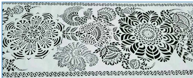
Фото 3. Фрагмент витинанки «Сумські береги»

королевецький рушник, основними її орнаментами є «Дерево життя» та «Берегиня роду». Над реалізацією проєкту майстрині працювали упродовж трьох місяців. Виріб зафіксований та внесений до «Книги рекордів України» [3].