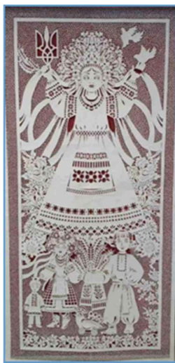
Фото 2. Витинанка «Трансформація життя»