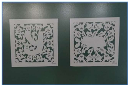
Фото 4. Витинанки «Мережана абетка»

У 2023 р. майстриня презентувала унікальну виставку «Мережана абетка», на якій були представлені витинанки з літер, що вписані в слобожанські рослинні мотиви.