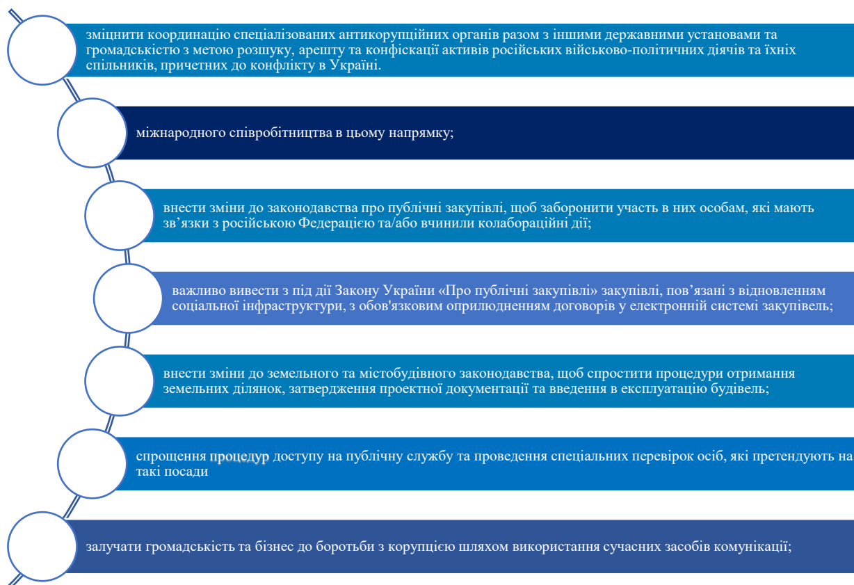
Рис. 1. Пріоритети антикорупційної реформи в Україні за А. Марченко

Створено автором на основі матеріалів [9, с. 82-83]