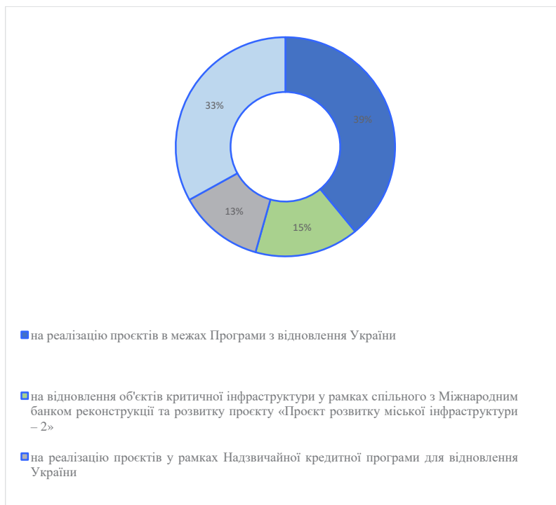
Рис. 3. Напрямки розподілу субвенцій місцевим бюджетам на відновлення та відбудову за 2023 рік

Створено автором на основі матеріалів [15]